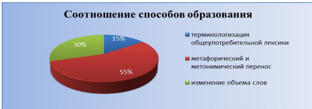
Диаграмма 3. Лексико-семантический способ номинации

Таким образом, мы пришли к выводу, что процентное соотношение лексико-семантического способа образования терминов выглядит следующим образом (см. диаграмму 3):